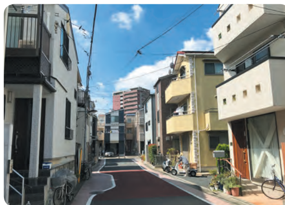
道路拡幅による市街地改善