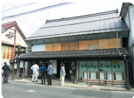
歴史的建物の防災対策