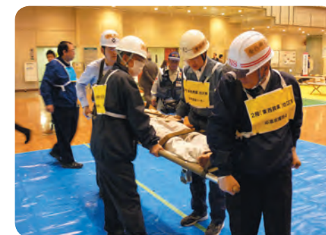
事業所の自衛消防訓練