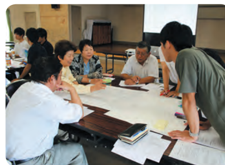
住民主体の防災計画作成