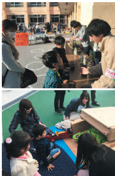
イザ！カエルキャラバンの実施風景

中でも、毎年開催されている「イザ！カエルキャラバン」は、子供たちにゲーム感覚で楽しく防災知識を習得してもらう機会となっています。年度毎にテーマを変更したり、子供たちと関わりがあるボーイスカウトや、子供と高齢