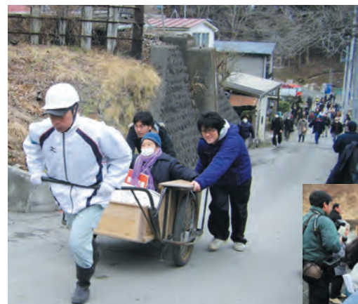
地区防災計画に沿った防災訓練の実施風景

地区防災計画は、地域特有の防災計画と位置付けられるもので、全国的に作成が進められています。住民主体のまちづくりの応用・発展編でもあり、専門家とともにしっかりとした地域の防災を考える機会になるようです。