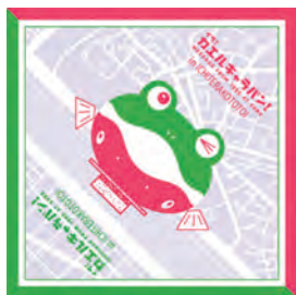
地域独自の防災バンダナ

硬直化・マンネリ化しやすい防災まちづくりに対して、無理をせず、楽しく参加してもらうことで、新たな担い手を育成するとともに、幅広い活動主体との連携を進めているのです。