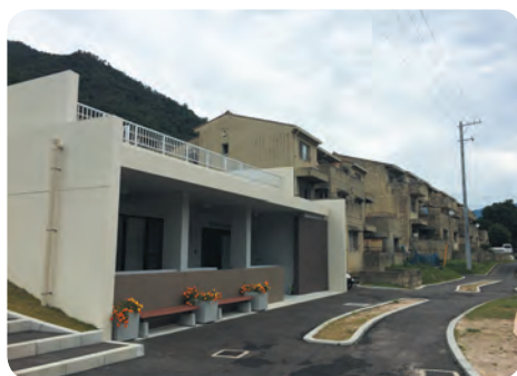
土砂災害に対応した集会所整備