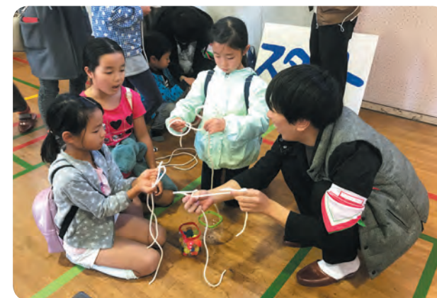
ゲーム形式を活用した防災教育ワークショップ