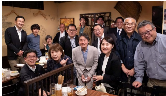
写真－研究会後の懇親会風景

次回、第2回(6/5((月)18:30～)は、塩尻市、上田市の都市計画・まちづくりについて報告いただくとともに、UDC信州の取り組みや課題を含め、より具体的なまちづくりについて議論する予定です。参加希望の方は、下記のフォームから申し込みください。