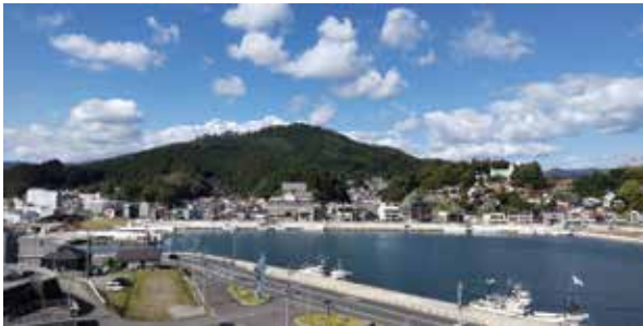
風待ち地区の風景

内湾地区は、宮城県北端の港町として栄えた町で、かつて船乗りたちが船出の風を待ったことから「風待ち地区」と呼ばれています。大正4年と昭和4年の大火により市街地の大半が焼失しましたが、全国からの支援で復興し和洋折衷など様々な形式の個性的な建物が立ち並びました。