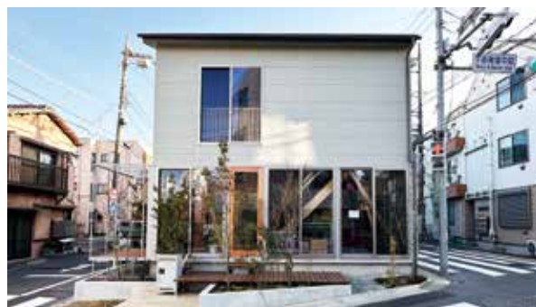
せんつく2(2022年12月開業)

2022年3月に、千住地域を対象としたマネジメント型まちづくりファンドが組成された。このファンドは、地域金融機関と民間事業者の連携により実現し、「せんつく2」の開業を支える資金的な基盤となっている。ファンドの継続的な活用のためには、対象となる物件とまちづくりを担う事業者の継続的な発掘と情報の蓄積が必要であり、足立区と不動産事業者、空き家利活用団体が協力してこの取り組みを支えている。まちづくりファンドの検討会議から派生したまちづくり会議は、2020年頃から毎月1回開催し続けており、千住地域の活動を支える非常に重要な情報共有の場として機能している。