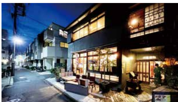
せんつく1の夜景(路地に灯りを灯す)

私の事務所が中心となって進めている空き家利活用事例である複合施設「せんつく」の開業(2020年)は、空き家所有者と民間事業者のマッチングによって実現した。この施設は、空き家の再生だけでなく、地域住民との交流の場を提供し、木造密集市街地の都市基盤の改善にも貢献している。また、2022年には「せん