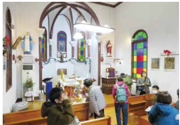
まちあるき(気仙沼カトリック教会)

再建前から継続しているまちあるきでは「けせんぬま遺産」として、文化財建物以外の歴史ある店舗を含めたり、風待ち地区の風景や人々も魅力として伝えるマップを作成しました。昨年度は初めてクリスマスバージョンのまちあるきを開催し、明治時代建築と伝わる気仙沼カトリック教会の見学や、地元の方の協力を得てクリスマスクッキーのプレゼントにもチャレンジしました。