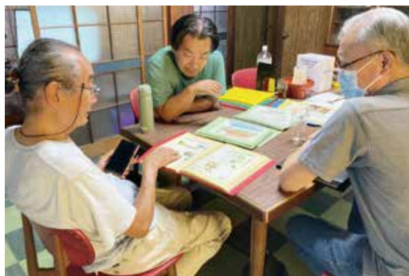
アーカイブ部会の活動の様子