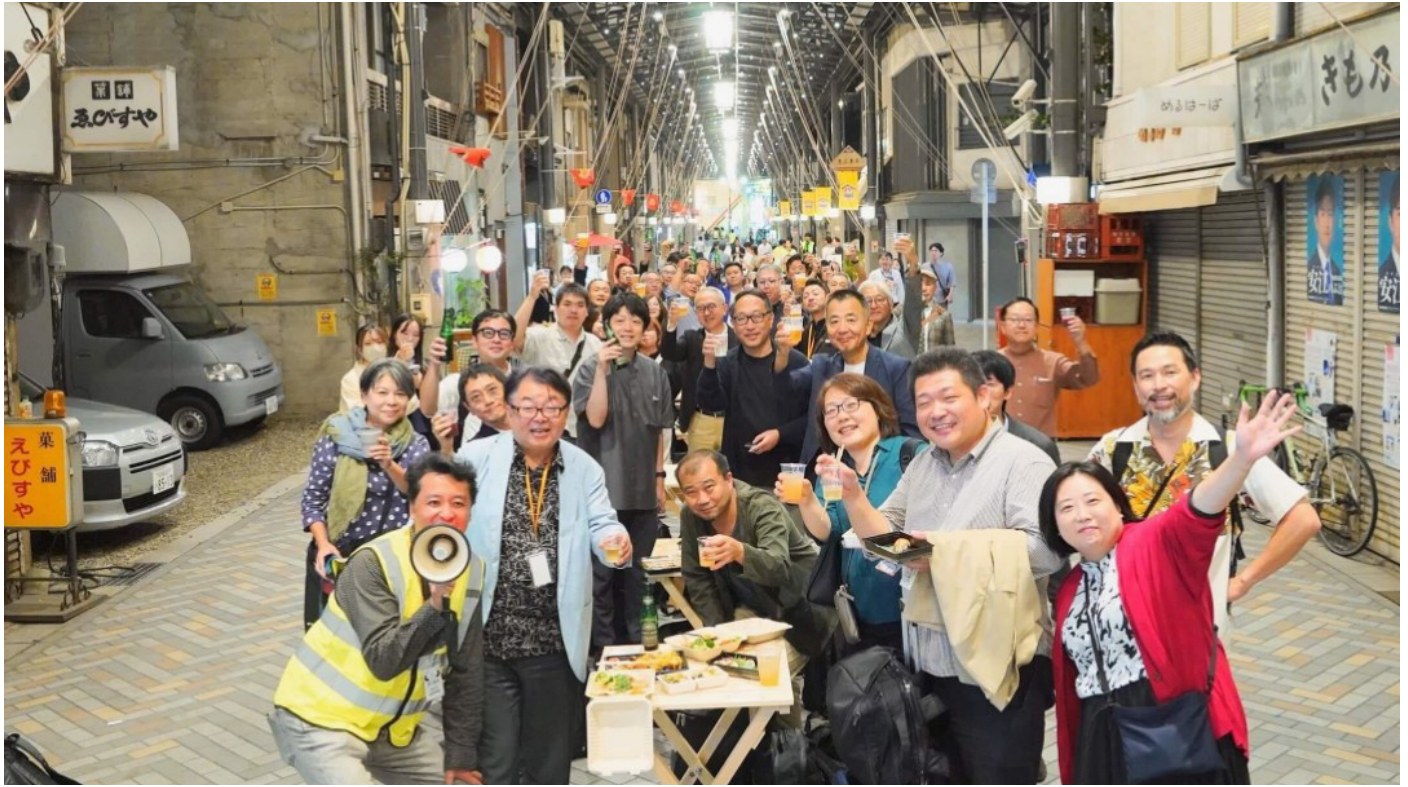
全国まちづくり会議 2024 in ナゴヤの様子